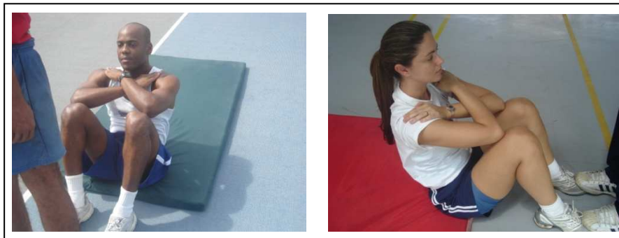
Figura 3 – Flexão de tronco sobre as coxas para os sexos masculino e feminino

Neste exercício serão exigidos os mesmos padrões de execução para ambos os sexos.