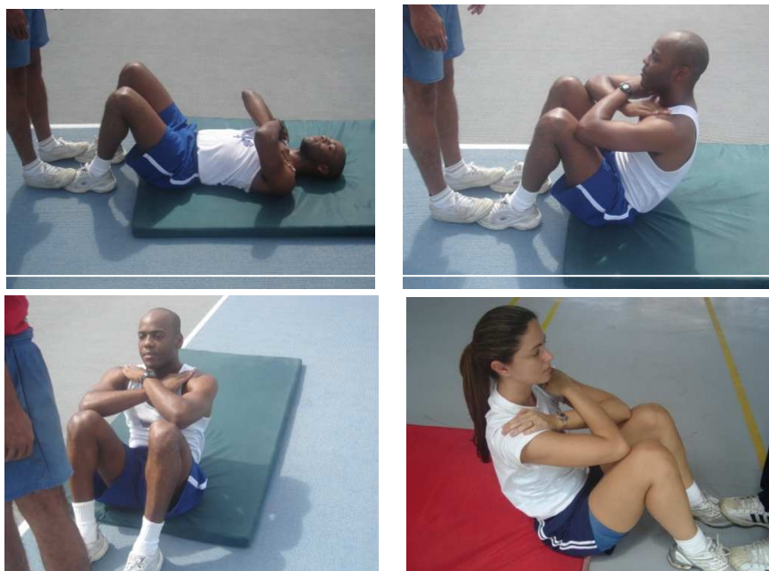
Figura 3 – Flexão de tronco sobre as coxas para os sexos masculino e feminino Neste exercício serão exigidos os mesmos padrões de execução para ambos os sexos.