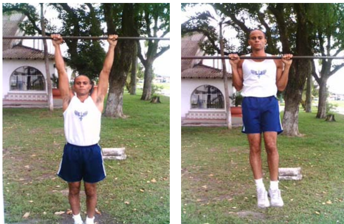
Figura 1 – barra fixa para o sexo masculino