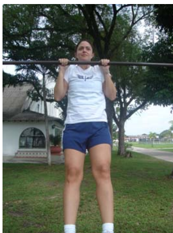
Figura 2 – barra fixa para o sexo feminino