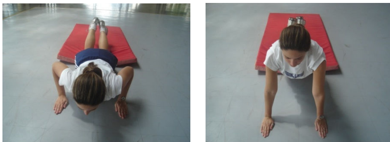
Figura 2 – Flexão e extensão dos membros superiores com apoio de frente sobre o solo para o sexo feminino