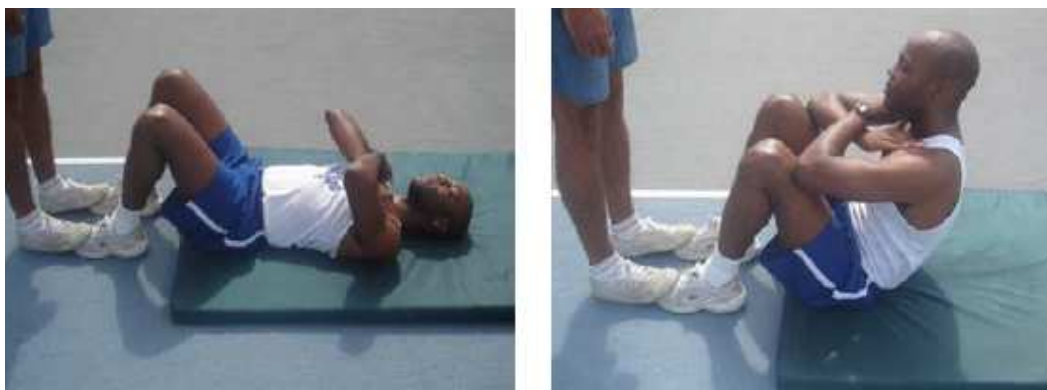
Figura 2 – Flexão de tronco sobre as coxas.

Será avaliado através da flexão do tronco sobre as coxas.