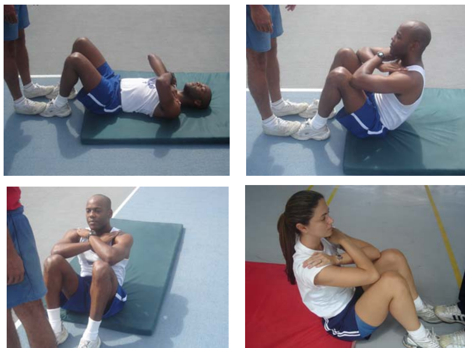
Figura 3 – flexão de tronco sobre as coxas para os sexos masculino e feminino

Obs.: Neste exercício serão exigidos os mesmos padrões de execução para ambos os sexos.