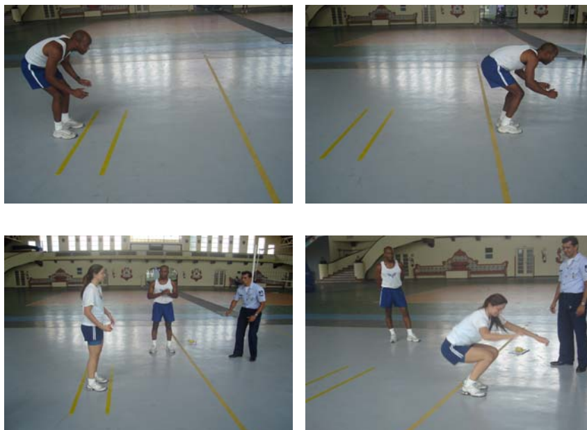
Figura 5 – salto horizontal para os sexos masculino e feminino