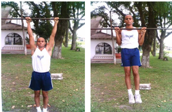
Figura 1 – flexão na barra fixa para o sexo masculino