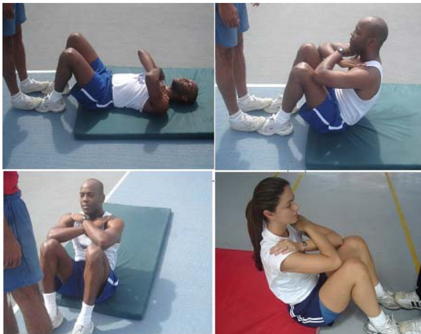
Figura 1- Flexão do tronco sobre as coxas

Obs.: Neste teste, serão exigidos os mesmos padrões de execução para ambos os sexos.